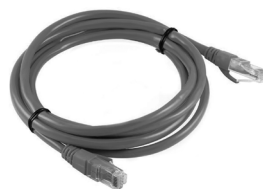
2 Cabo Ethernet