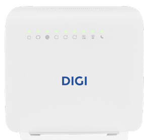
1 Router WIFI

Aqui encontras as instruções necessárias para ligar o teu router WIFI à internet de forma simples e rápida. Basta seguirem estes 3 passos para que possas desfrutar da fibra óptica DIGI em tua casa: